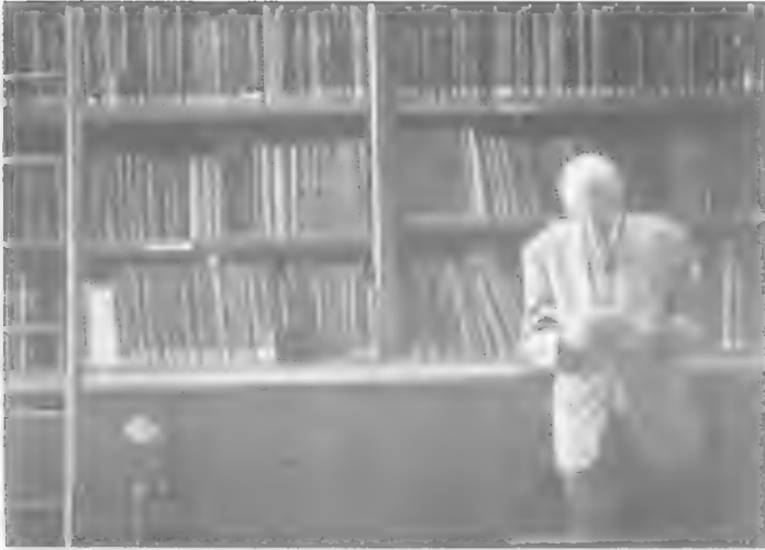
لوير في مكتبة المعهد الفرنسي للآثار الشرقية